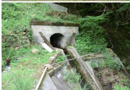
自然豊かな風景、とても懐かしい気持ちになりました。