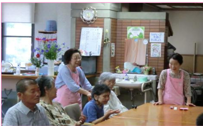
「かけはし」様 話も弾み皆さん ニコニコ☀

普段お世話になっている「あじさい」様と「かけはし」様におかの花デイサービスへのコメントをいただきましたので紹介させていただきます。