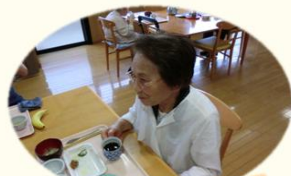
モーニングコーヒーで目覚めてます☀