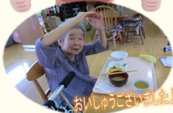
おいしゅうございました♪